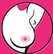
zmiana kształtu brodawki