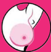
zaczerwienienie lub uczucie gorąca