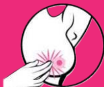
obrzęk lub ból przy ucisku