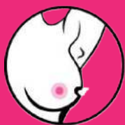
wkłęśnięcie na jednej lub obu piersiach