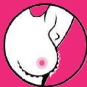
wgłębienia na skórze