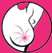
poszerzone i bardziej widoczne żyły